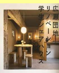
トレイル廃材需要開拓