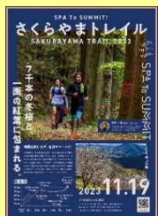
さくらやまトレイル