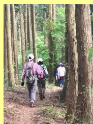
桜山セラピー認証